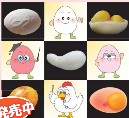
卵事例ハンドブック編集委員会

異常卵や特徴的な卵の発生原因と背景 消費者からのお申し出や素朴な疑問に応えるために